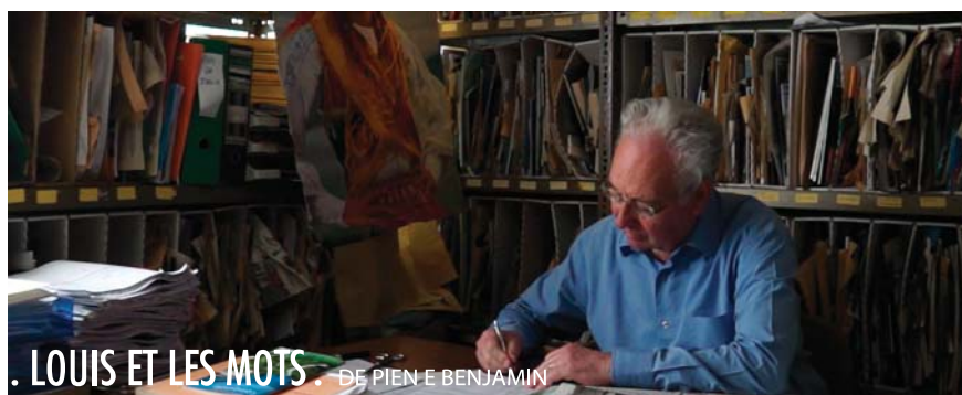
. LOUIS ET LES MOTS . DE PIEN E BENJAMIN