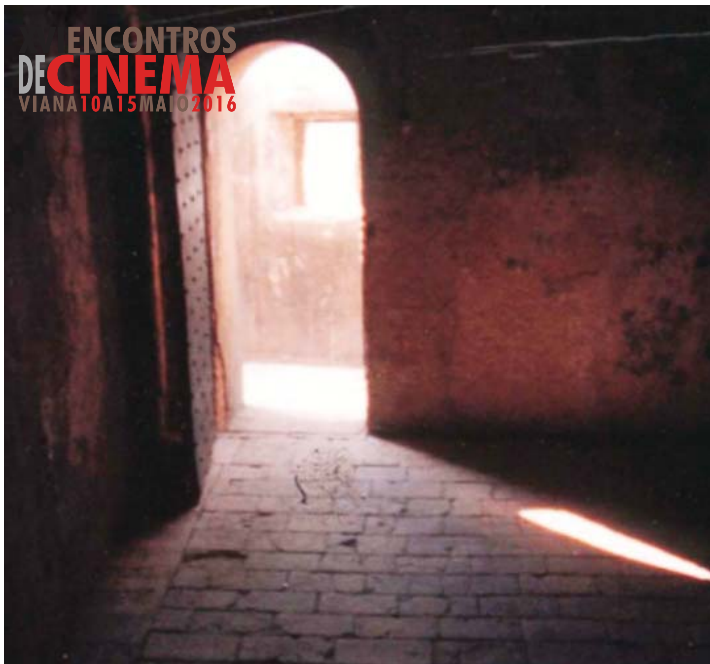
"Gammelion", Gregory Markopoulos, ©Temenos Archive, 1967

ENCONTROS DE CINEMA VIANA 10 A 15 MAIO 2016